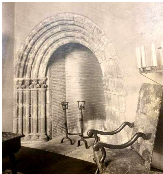
La fenêtre de la façade de la maison, devenue encadrement de cheminée

La maison est vendue au Département en 2022 qui souhaite en faire un lieu culturel, les travaux dureront plusieurs années. Des archéologues ont déjà effectué des fouilles dans la cour et la maison et une modélisation numérique en 3D de la maison a été réalisée.